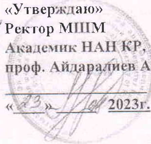
График проведения туров вступительных испытаний абитуриентов в Международную школу медицины Международного университета Кыргызстана на 2023-2024 учебный год