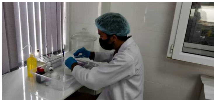
Фото 2. Освоение методик окрашивания микроорганизмов (лаб. 208)