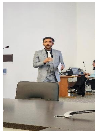
Фото 4. Конференции МВШМ