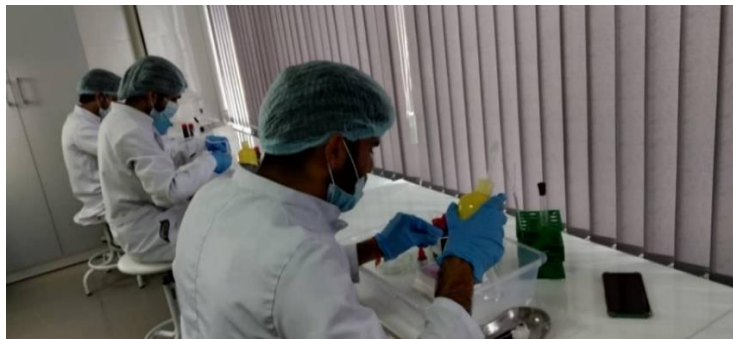
Фото 1. Работа студента в лаборатории во время занятия в кружке по микробиологии (лаб. 208)

Целью работы студенческого научного кружка является привить знания и навыки по изучению различных микроорганизмов в лабораторных условиях, усваивать методы, используемые в микробиологии: подготовка питательных сред для проведения исследований, окрашивание микроорганизмов, исследования микроорганизмов под микроскопом и др. методы, подготовка обучающихся к участию в различных научных мероприятиях (олимпиады, студенческие конференции, подготовка статей к публикациям).