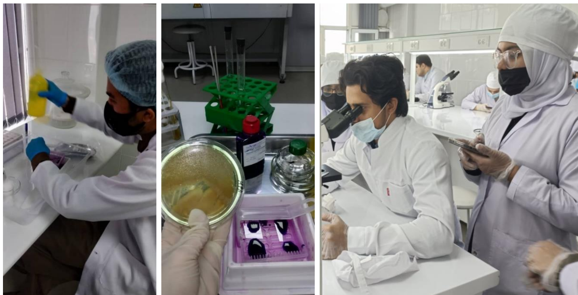
Фото. 3. Освоение методов окрашивания и подготовка плашек с окрашенными микроорганизмами к помещению их в термостат (лаб. 208)