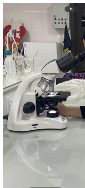
Фото с занятий научного кружка по нормальной физиологии